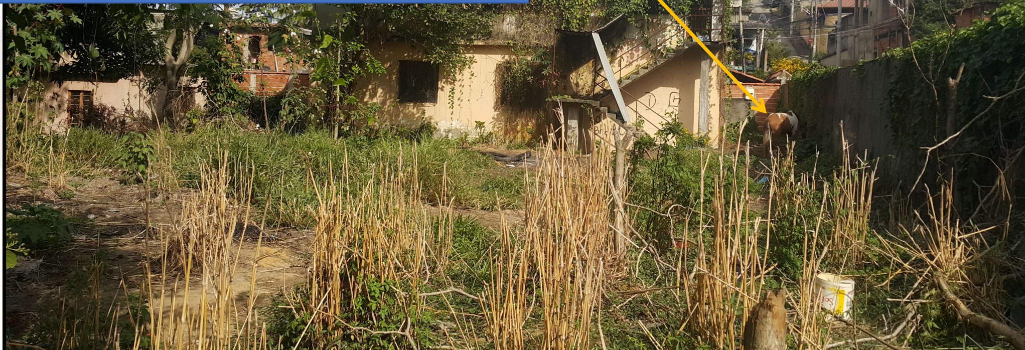
Foto tirada sobre a galeria de água pluvial e a nova sugestão de local para compostagem. Ainda contamos um cavalo, situação a ser mediada ainda com o dono. Ele comeu tudo o que tinha, as linhas de produção, a compostagem as bananeiras...